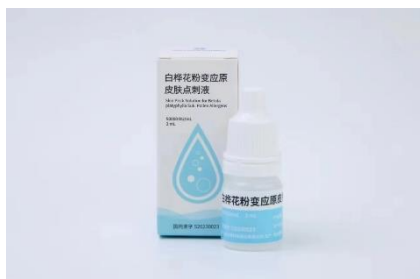
白桦花粉变应原皮肤点刺液