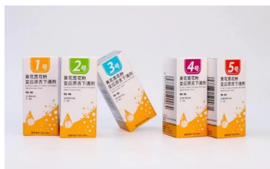
黄花蒿花粉变应原舌下滴剂