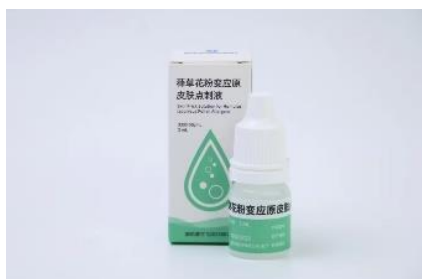
葎草花粉变应原皮肤点刺液