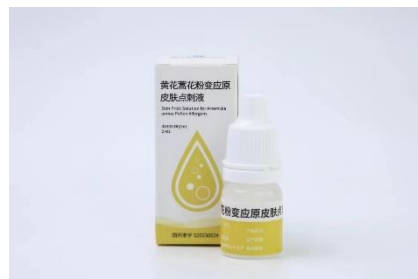
黄花蒿花粉变应原皮肤点刺液